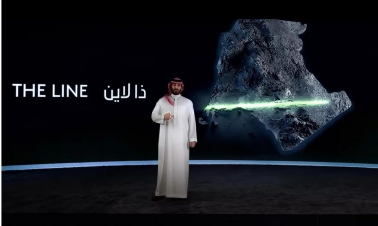
مشروع ذا لاين

الرياض- أعلن ولي عهد السعودية الأمير محمد بن سلمان يوم الاثنين المعادل لـ 25 يوليو 2022 عن نية المملكة العربية السعودية لبناء هيكل سكني عملاق لاحتواء 9 ملايين نسمة تحت مسمى مشروع ذا لاين “The Line”.